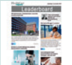
Leaderboard (eNews) 728 px x 90 px