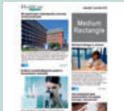
Medium rectangle (eNews) 300 px x 250 px