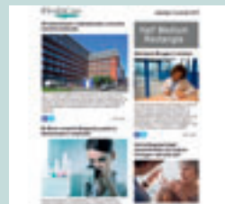
Half medium rectangle (eNews) 300 px x 125 px