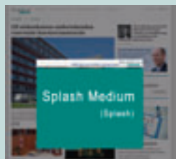
Splash Medium 640 px x 480 px