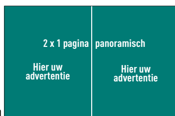
2 x 1 pagina panoramisch