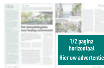
1/2 pagina horizontaal