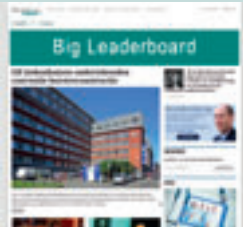
Combi-BAN2 960 px x 150 px