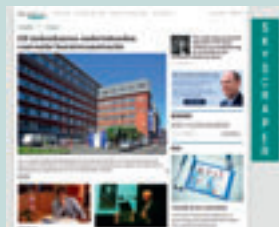
Combi - SKY 120 px x 600 px