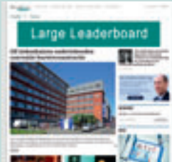
Combi-BAN3 840 px x 150 px