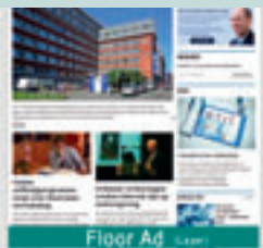
Floor ad 970 px x 90 px