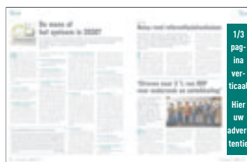
1/3 pagina verticaal