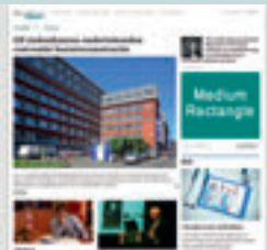
Combi - MEDRECT 300 px x 250 px