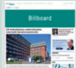
Combi-BAN1 970 px x 250 px