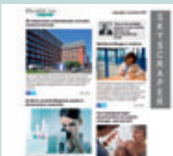
Skyscraper (eNews) 120 px x 600 px