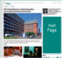
Combi - HALFP 300 px x 600 px