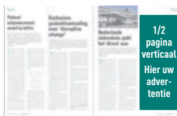
1/2 pagina verticaal