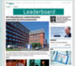
Combi-BAN4 728 px x 90 px