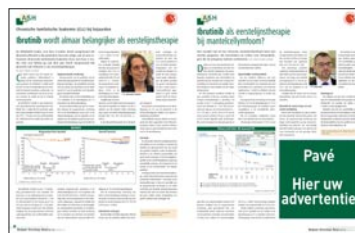
Pavé H 117 mm x B 117 mm