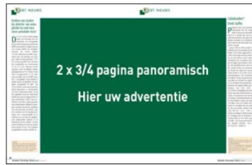
2 x 3/4 pagina panoramisch H 282 mm x B 388 mm