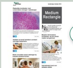
Medium rectangle (eNews) 300 px x 250 px