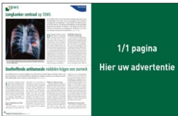
1/1 pagina H 340 mm x B 270 mm