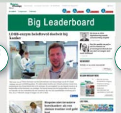
Combi-BAN2 960 px x 150 px