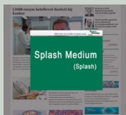
Splash Medium 640 px x 480 px