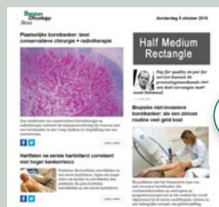
Half medium rectangle (eNews) 300 px x 125 px