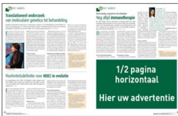
1/2 pagina horizontaal H 145 mm x B 240 mm