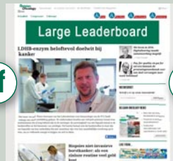
Combi-BAN3 840 px x 150 px