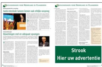
Strook H 88 mm x B 240 mm