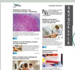
Skyscraper (eNews) 120 px x 600 px