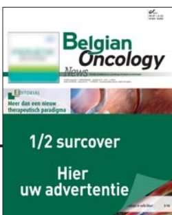
Surcover 1/2 H 170 mm x B 270 mm