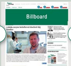
Combi-BAN1 970 px x 250 px