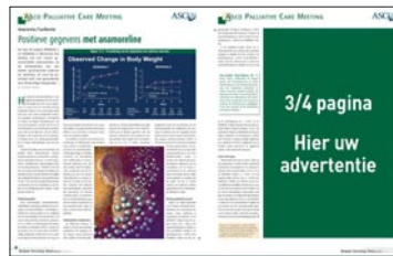
3/4 pagina H 282 mm x B 179 mm