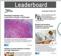
Leaderboard (eNews) 728 px x 90 px