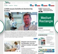
Combi - MEDRECT 300 px x 250 px