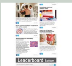
Leaderboard bottom 728 px x 90 px