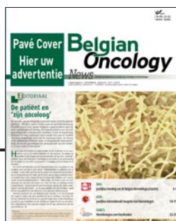
Pavé cover H 80 mm x B 80 mm