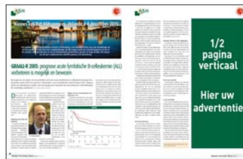
1/2 pagina verticaal H 282 mm x B 117 mm