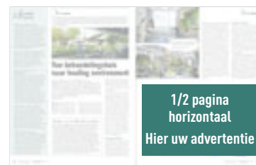
1/2 pagina horizontaal H 145 mm x B 240 mm