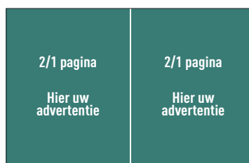
2/1 pagina panoramisch H 340 mm x B 540 mm