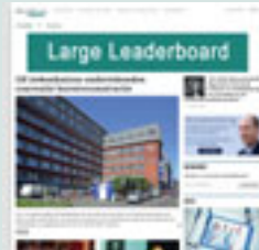
Combi-BAN3 840 px x 150 px