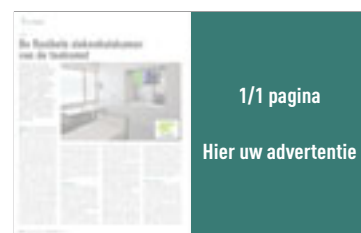
1/1 pagina H 340 mm x B 270 mm