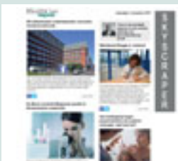
Skyscraper (eNews) 120 px x 600 px