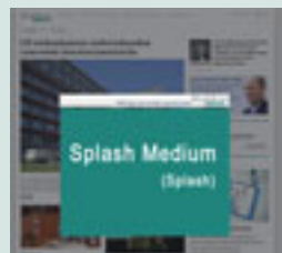
Splash Medium 640 px x 480 px