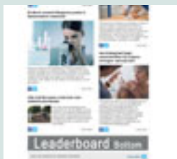
Leaderboard bottom 728 px x 90 px