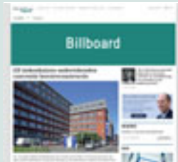
Combi-BAN1 970 px x 250 px