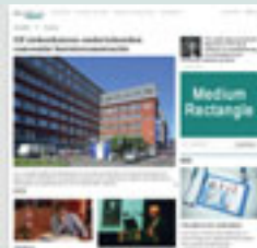
Combi - MEDRECT 300 px x 250 px