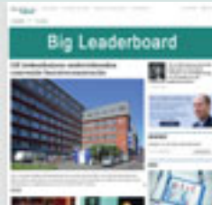
Combi-BAN2 960 px x 150 px