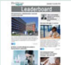
Leaderboard (eNews) 728 px x 90 px