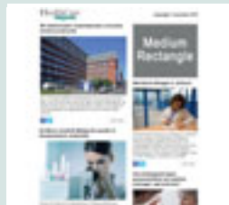
Medium rectangle (eNews) 300 px x 250 px