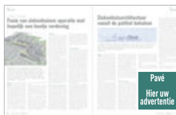
Pavé H 117 mm x B 117 mm