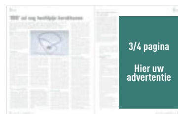
3/4 pagina H 282 mm x B 179 mm