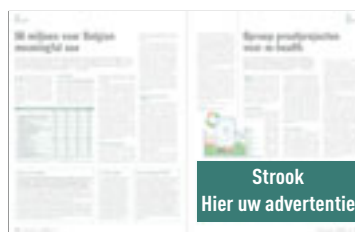
Strook H 88 mm x B 240 mm