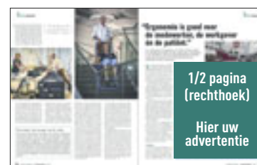
1/2 pagina rechthoek H 200 mm x B 179 mm