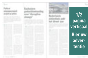
1/2 pagina verticaal H 282 mm x B 117 mm