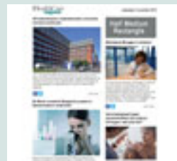
Half medium rectangle (eNews) 300 px x 125 px